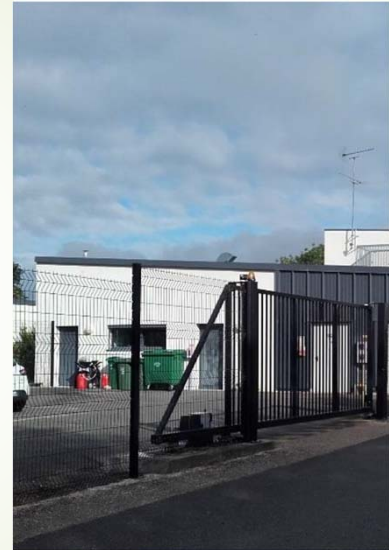
CEF La Source du Rollin

Lenzi, C., & Milburn, P. (2015). Les centres éducatifs fermés : de la clôture institutionnelle à l'espace éducatif. Espaces et sociétés, n° 162(3) , page 96.