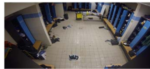
Le vestiaire de l'équipe professionnelle selon les deux angles de vue différents