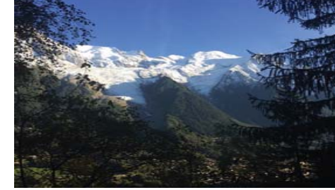
Le terrain d'entrainement des chasseurs alpins : un terrain à hauts risques