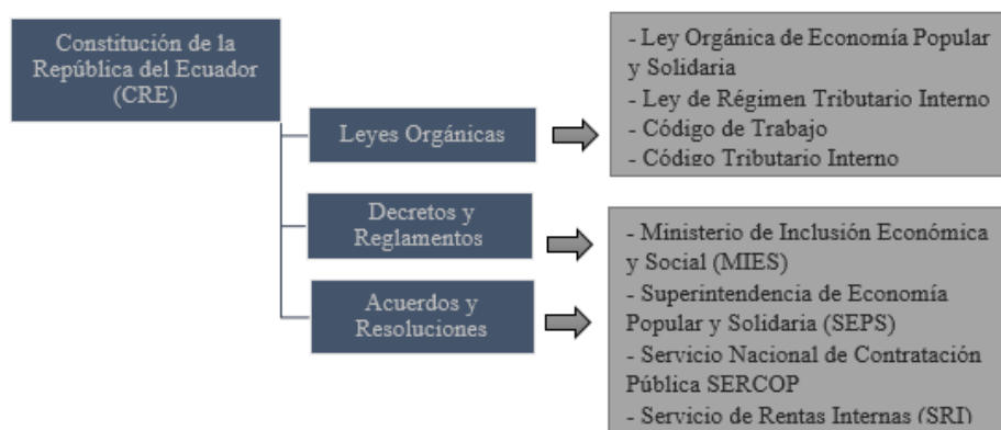
Figura 1. Legislación jurídica que rige para las oeps, en el Ecuador hasta abril de 2018, ordenada de acuerdo al nivel de jerarquización de las leyes. Información recopilada en la investigación.

Legislación Vigente para el Sector de la Economía Popular y Solidaria en el Ecuador (2018).